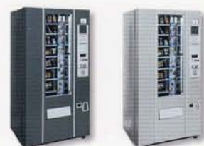
Colores estándar, serie Silverstone